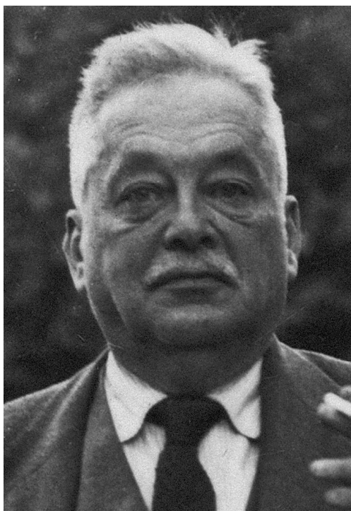
М. А. АЛДАНОВ